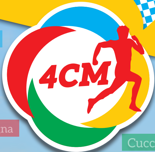
graphic by Freegineviro.com - © - Mario Gineviro